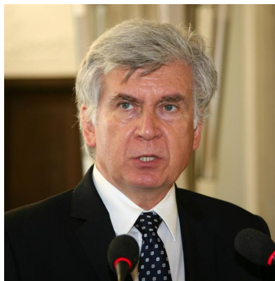
Goście Honorowi Konferencji Wicemarszałek Eugeniusz Grzeszczak, Minister Olgierd Dziekoński;