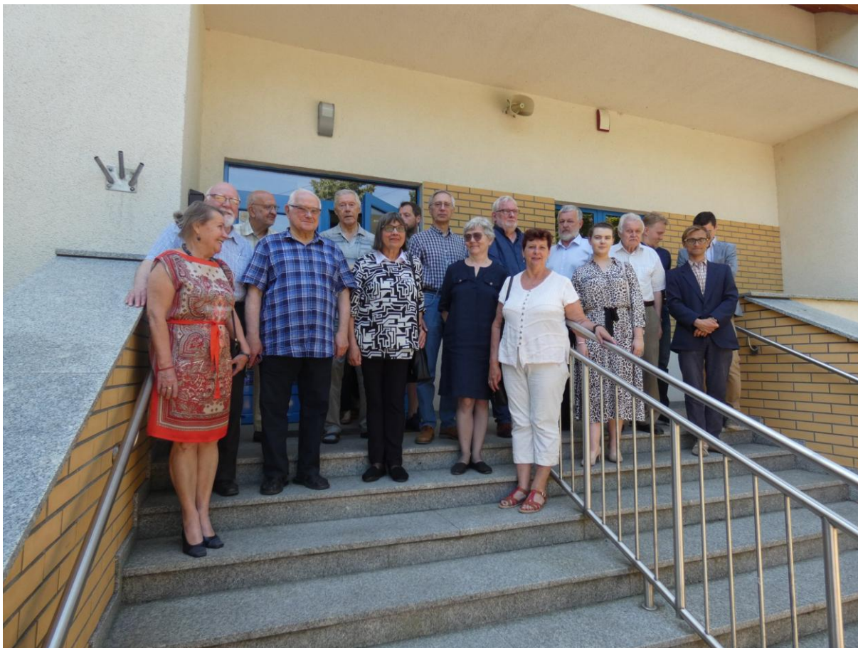
Uczestnicy konferencji przed Muzeum.