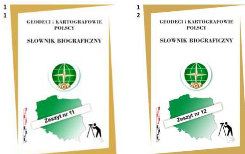
Dwa nowe zeszyty 11. oraz 12.

techniki i gospodarki nie tylko na skalę krajową. Całość została zbroszurowana w futerale – podobnie jak tom I. Ukończenie prac nad II tomem zbiega się z WALNYM ZEBRANIEM DELAGATÓW SGP, które odbędzie się w Białymstoku (20-22 maj 2022 r.) pod hasłem „Geodezja i kartografia podstawą zarządzania przestrzenią państwa”.